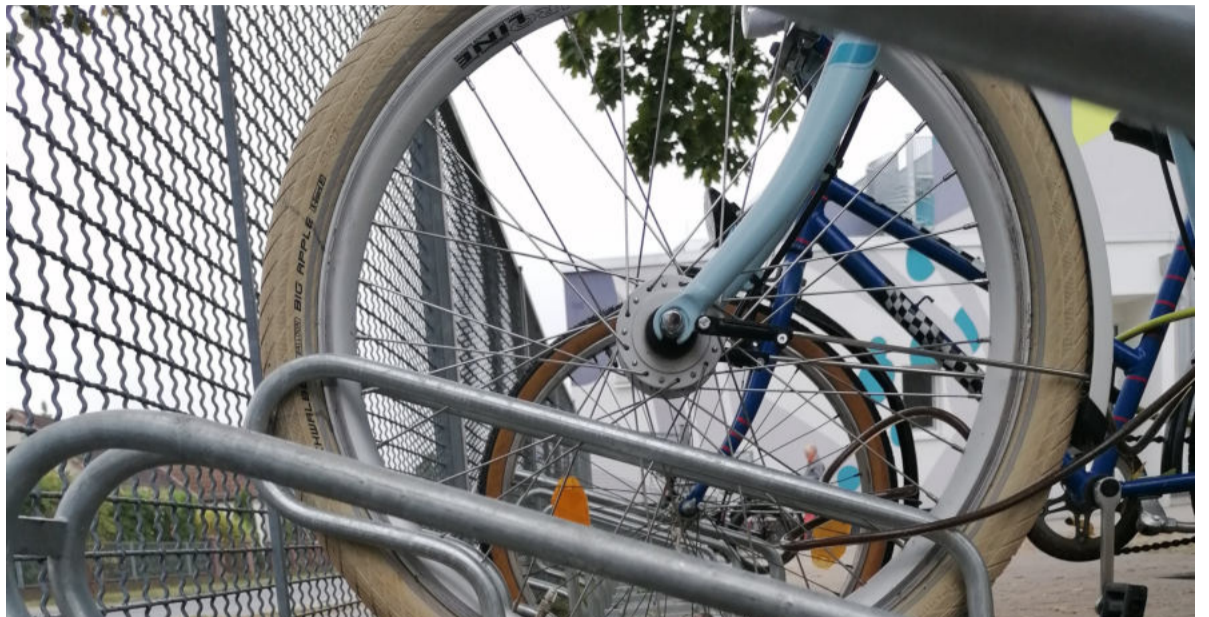
Die Fahrradständer der Schule stehen zu eng. Für manche Reifen sind sie zu schmal. Viele Schülerinnen und Schüler sind unzufrieden.

VON NELE GÖPFERT UND GUNDEL KREYß Seit Anfang des Schuljahres 2019/20 hat die Grundschule Bestensee neue Fahrradständer. Viele Schüler und Schülerinnen sind der Einsicht hin geneigt, dass zu wenig Platz ist. Doch eher wenige sind der Meinung, dass die Anzahl der Fahrradständer genau passt. Tatsächlich ist die Anzahl der Fahrradständer ausreichend, doch der Platz zwischen den Fahrrädern ist zu klein. Das hat zur Folge, dass die Fahrräder sich verhängen, wenn man sie abstellen will. Manche Fahrräder haben Körbe, die dann nicht passen. Aber kann man das ändern? Man könnte die Fahrradständer verlängern. Probleme gibt es nicht nur wegen des Platzes. Manche Schülerinnen und Schüler sind der Ansicht, dass der Fahrradstellplatz abschließbar sein sollte, wenn es zum Reingehen klingelt. Es sind schon viele Beschwerden gekommen, dass die Fahrräder beschmutzt werden oder