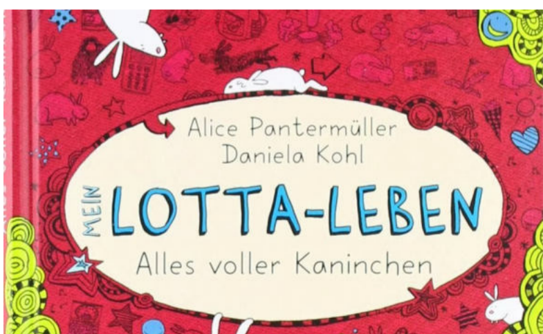
So sieht das Cover des Buches "Lotta Leben - Alles voller Kaninchen" aus.